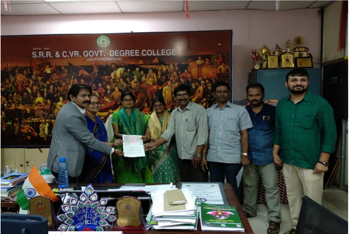
ఏజీ కార్యాలయంతో తెలుగు పరిచయం కోర్సు ఒప్పందం